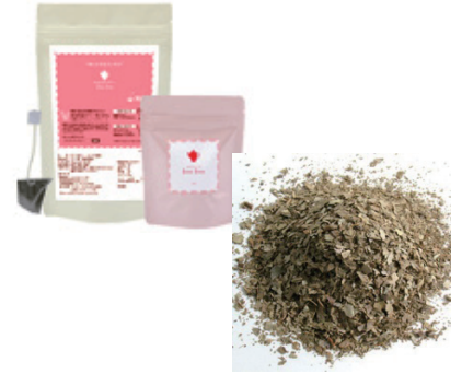
"Product Name: Juju Guava Tea"