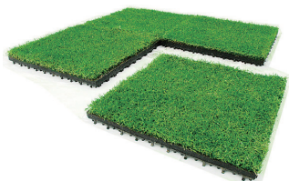
「エコグリーンマット」

自然の土壌で屋上芝緑化を行う場合約160Kg/m 2 の加重がかかり、建築基準法により、補強工事が必要となります。エコグリーンマットは39Kg/m 2 で既存ビルにも施工が可能です。