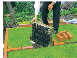
「簡単な施工と改修」 および「長期の植生」

エコグリーンマットは、土を用いたの植栽と比べ、軽量で、厚さも約1/5の為、施工(最短2日)・改修が簡単。耐用年数も12年(2014年時点で16年の実績)と一般の土と比べ長く「導入・維持費用の削減」ができます。