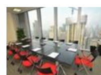
上海情報センター